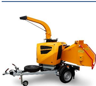
LS160 DWB O2