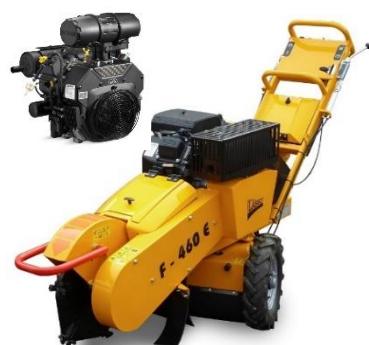
F460E (motor ECH749 niet op machine)