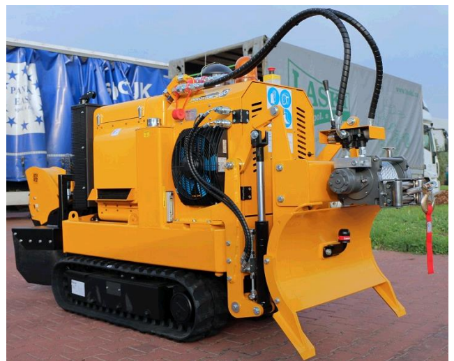
Optie: Lier voor P56RX