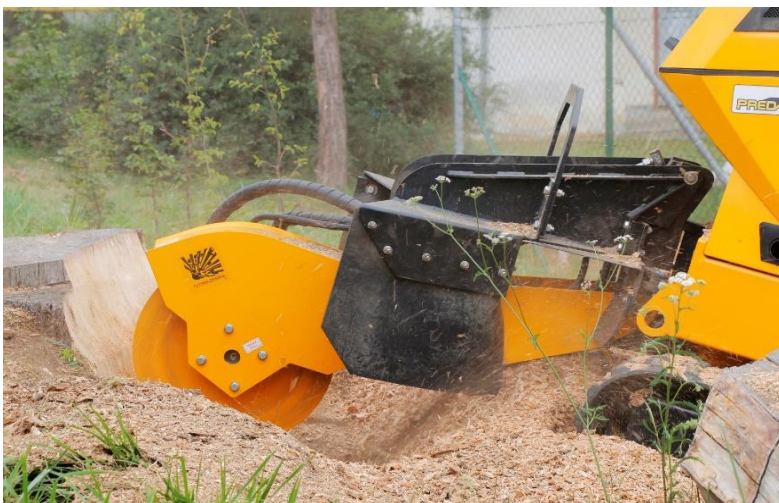
P56RX in actie