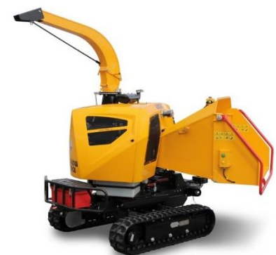
LS160 DW Track