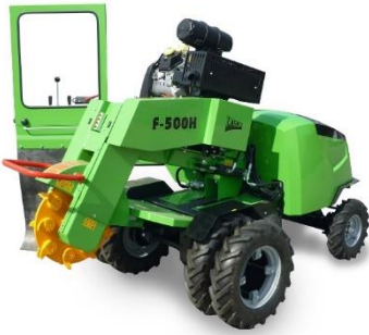
F500H/27 met dubbele wielen