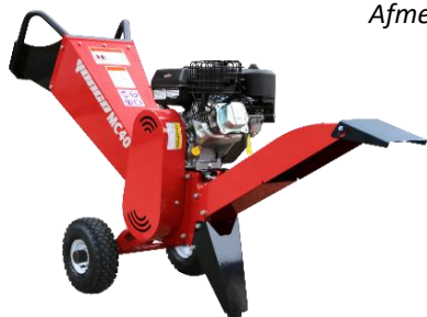
MC40 met hoge uitvoer